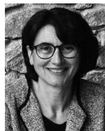
Olivier KLEIN Ministre délégué de la Ville et du Logement