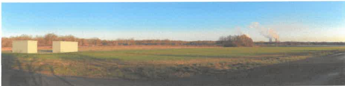
Photographie de vue panoramique de la zone d'étude, vu depuis la route D54, point situé au nord de la parcelle de référence.