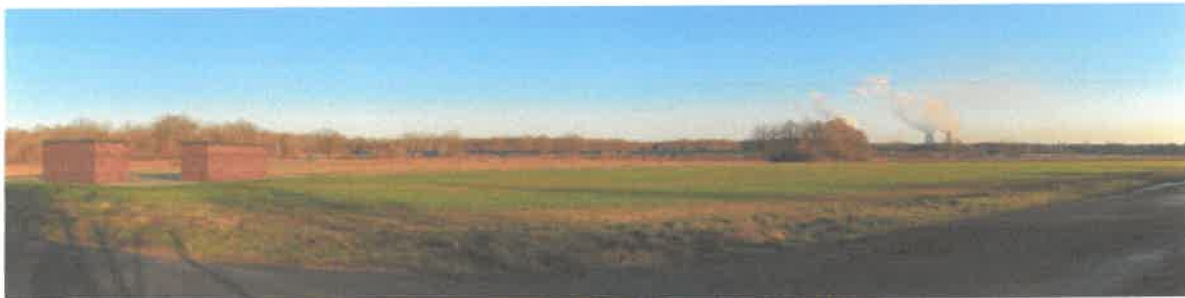
Photographie de vue panoramique de la zone d'étude, vu depuis la route D54, point situé au nord de la parcelle de référence.

Sur le rapport de Madame le Maire, après en avoir délibéré, le Conseil Municipal, à l'unanimité, émet un :