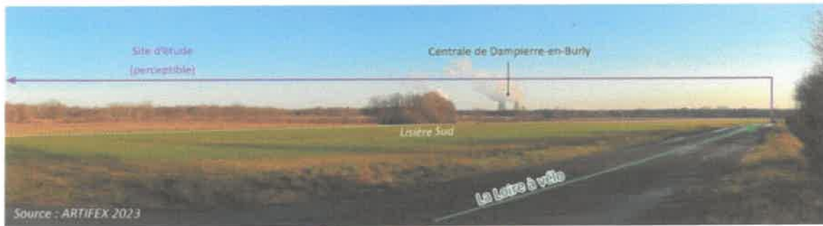
Depuis la route D54 et le circuit Le Loire à vélo