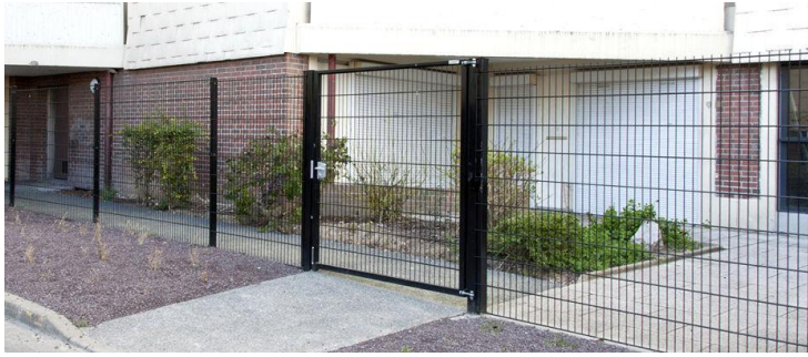
Référence de portail et portillon de la continuité de la clôture standard