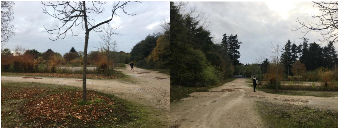
Photos du terrain existant

Les végétaux présents sont les suivants : tilleul, saule, pin, cèdre, zelkova.