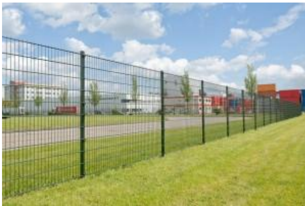
Référence de modèle pour la clôture standard

Des clôtures seront mises en œuvre sur tout le pourtour du parking. Il s'agit de clôtures standard, de 1,80 mètres de haut. Elles sont en acier thermolaqué, dans la continuité des clôtures du projet Co'Met adjacent. Les clôtures, portails et portillons auront une couleur uniforme sur tout le pourtour : gris foncé.